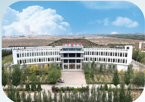
5月初，1000余株荷花藕苗顺利扎根德晟金属生活区池塘旁，本批次荷花取苗自河北省白洋淀水域。据说

五月的风， 零星地绿， 无名地绿， 和着运输车忙碌着。 不禁疑问， 树有年轮， 人有年龄， 山有什么？ 了解它的人，知道它一直在那里。 几时形成，而今几何，无人知晓。 远远望去，像极了孤单的老者。 然而， 它见证了一代代开山人， 从手提肩挑、驱赶马车， 到爆破大卡车的工艺变迁。 它见证了一批批守山人， 从削坡整形、植树种草， 到建煤仓、洒水降尘的环保努力。 或许某天，等风来时， 它也将见证，这里山花烂漫、硕果芳香。